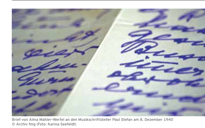
Brief von Alma Mahler-Werfel an den Musikschriftsteller Paul Stefan am 8. Dezember 1940

17. Oktober 2012 bis 30. Januar 2013 18:00 Uhr | HMTMH | Hörsaal 202 | Emmichplatz 1 | 30175 Hannover | Eintritt frei