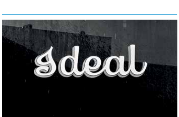
Lewis Baltz, „Ideal“, 1976, aus der Serie „The Prototype Works“, Silbergelatineabzug

Lewis Baltz (*1945 in Newport Beach, lebt in Paris und Venedig) ist einer der bedeutendsten internationalen Vertreter der konzeptuellen Fotografie. Mit einem sachlich nüchternen Blick richtete er seine Kamera auf den amerikanischen Alltag und ihre Umwälzungen durch die Konjunktur der Nachkriegszeit. Seine Werke fokussieren auf Bildreihen, die verschiedene Facetten eines Themas beleuchten und dem Betrachter eine Darstellung von Bewegung und Transition zeigen. Goseriede 11 | 30159 Hannover | Eintritt 7 € (erm. 5 €) Ausstellungseröffnung: 10 €