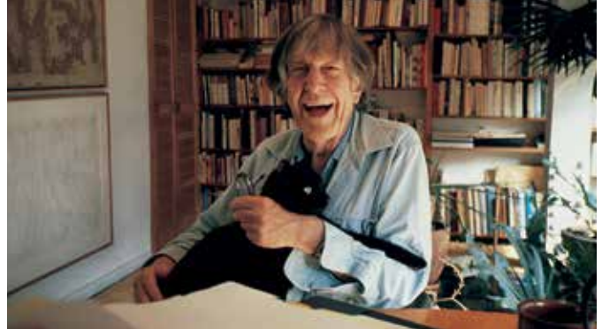
John Cage, New York, 1990